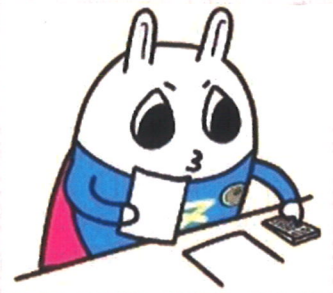
東京地方税理士会 イメージキャラクターの「トッチーくん」